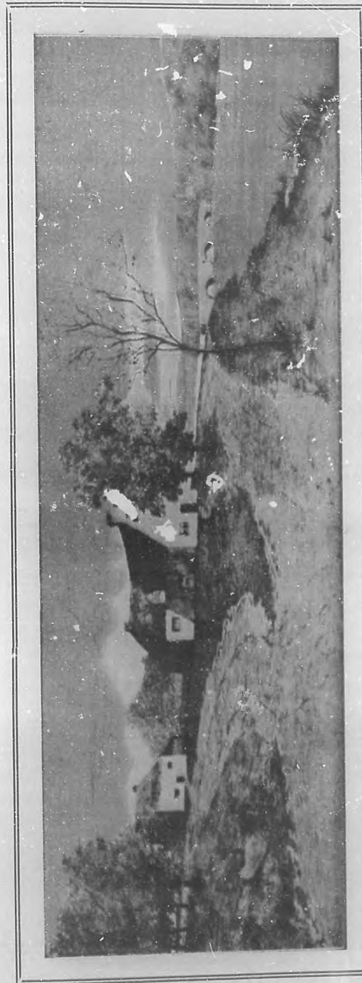
(Grabado tricolor de BOHEMIA.)

Ilustre y talentoso intelectual venezolano, autor de una muy notable obra titulada "Orientaciones Americanas", que acaba de ver la luz en esta capital.