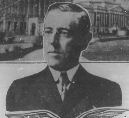
Mr. Woodrow Wilson Gentil Presidente de los Estados Unidos.

A Mr. Woodrow Wilson, gentil Presidente de los Estados Unidos, le ha sido adjudicado el Premio Nobel de la Paz, correspondiente al año mil novecientos dieinueve.