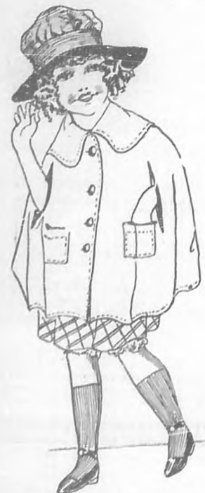
Modelo de capita para niños, cuyo patrón cortado recibirán los lectores de BOHEMIA, junto con el primer número de "Elegancias"

Juntamente con cada ejemplar de "Elegancias", recibirán nuestras lectoras un magnífico patrón cortado. El primer número de "Elegancias", que, como hemos dicho ya, lo recibirán nuestras lectoras en el próximo mes de febrero, además de su escogido material literario, contendrá trabajos referentes a las modas, asunto que es su verdadera índole, donde se harán oportunas explicaciones de las últimas noticias recibidas, se incluirán modelos seleccionados, Bordados, Lencería, estudios de la elegancia en aspectos tan curiosos como el cine y sobre todo, el magnífico patrón cortado, recomendable por sí solo.