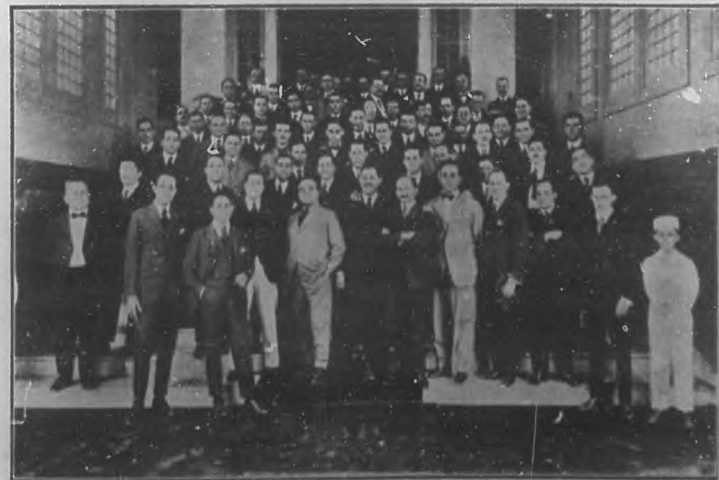
EL ALMUERZO DEL COLEGIO DE ARQUITECTOS EN EL CASINO DE LA PLAYA.— Los distinguidos concurrentes que asistieron al almuerzo celebrado en el Gran Casino de la Playa, por el Colegio de Arquitectos, con motivo de la toma de posesión de la Junta Directiva.

A continuación insertamos los nombres de los concurrentes: