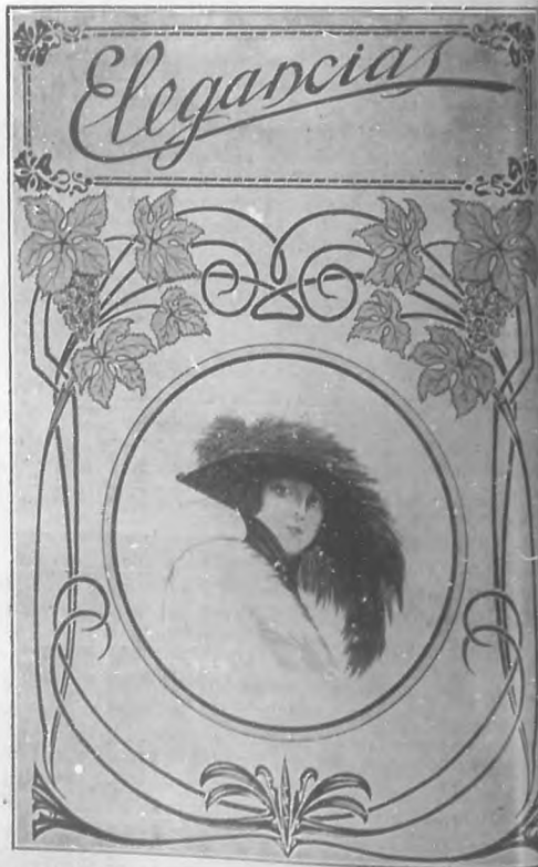
Facsimil de la bella portada del primer número de "Elegancias"

Tenemos la seguridad de que nuestras cultas lectoras reconocerán todo su alicance este obsequio que en los comienzos de este año les ofrece BOHEMIA. "Elegancias"—no lo dudamos—por sí misma se erige en una revista imprescindible para nuestras lectoras que encontrarán en ella una publicación interesantísima.