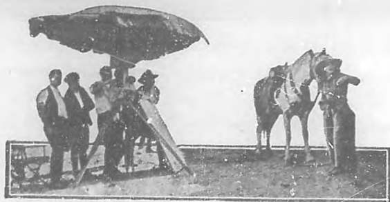
CHARLANDO CON MR. CARL LAEMMLE, PRESIDENTE DE LA UNIVERSAL FILM COMPANY

Posibilidad de un Estudio de la Universal en Cuba.—Bellezas de nuestros campos.—El Mercado Latino-Americano de la Universal.—En busca de una "estrella".—Sensacional Concurso que abre BOHEMIA comisionada por Mr. Laemmle.