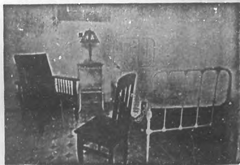
Una de las higiénicas habitaciones para operados en la "Clínica Ledon-Uribe".

Situada en la esquina de San Rafael y Mazón, próxima a la Universidad Nacional, alzáse a una altura de veinte y seis metros sobre el nivel del mar.