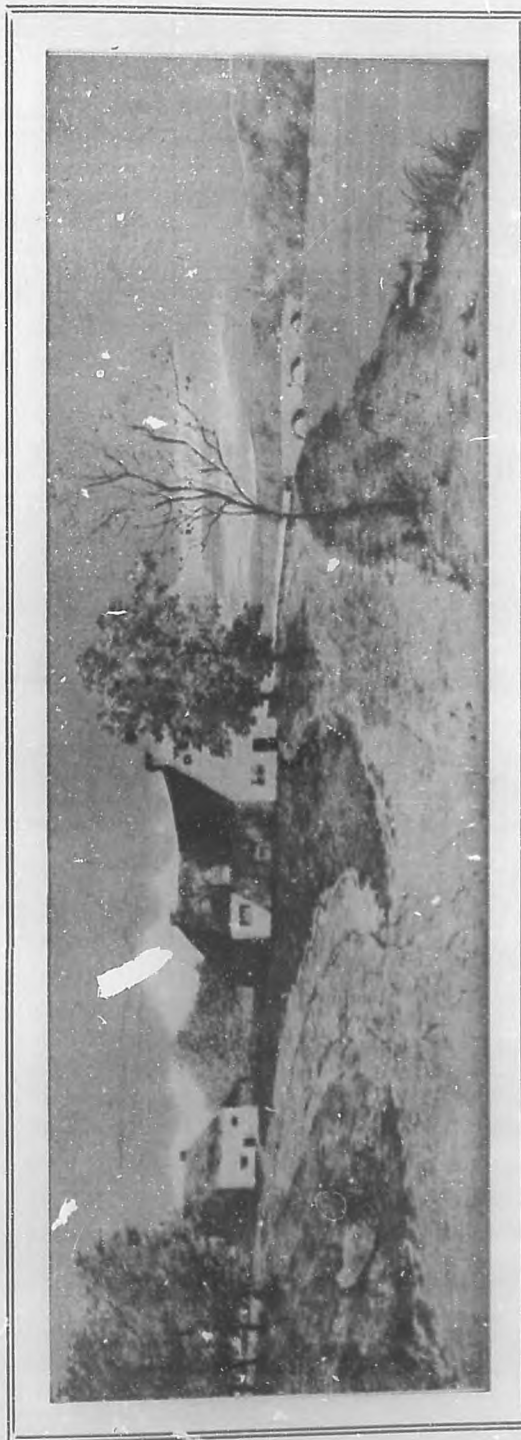
(Grabado tricolor de BOHEMIA.)

Ilustre y talentoso intelectual venezolano, autor de una muy notable obra titulada "Orientaciones Americanas", que acaba de ver la luz en esta capital.