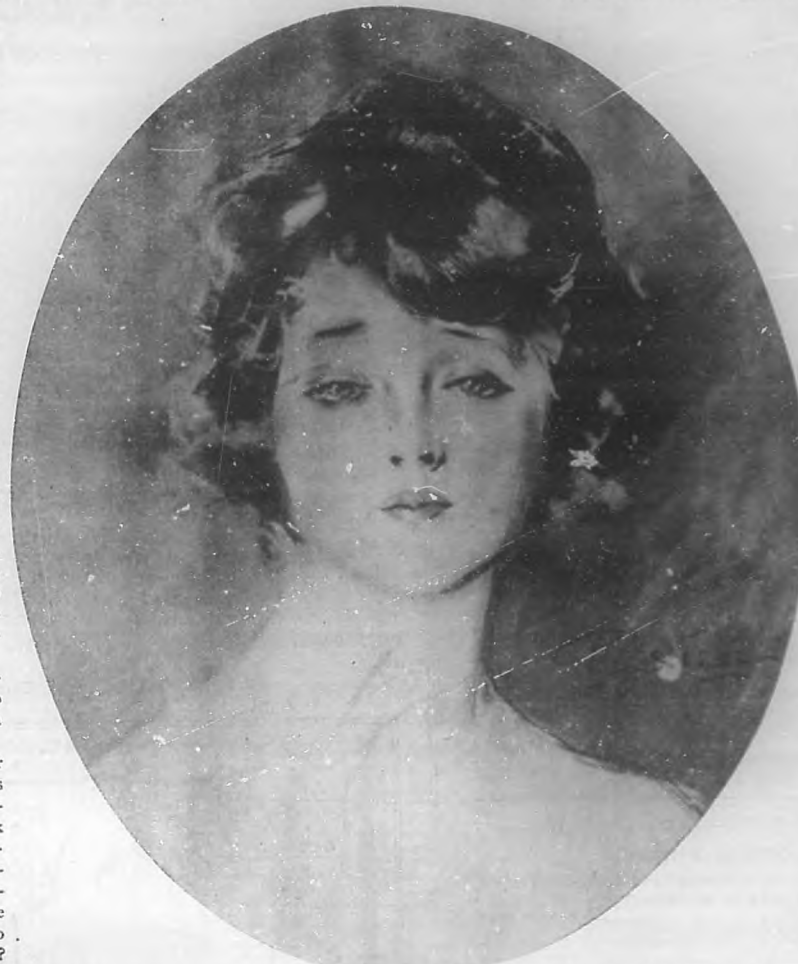
El pincel de Penhryn Stanlows, el artista exquisito, autor de las inimitables portadas de Hearst's Magazine, ha creado la maravillosa belleza del rostro que embellece esta página. Si la misión del arte es copiar la Naturaleza, embelleciéndola, Penhryn Stanlows lo ha conseguido plenamente.

—Sería preferible que supiese inglés, ¿no es cierto? (Pase a la Pág. 20)