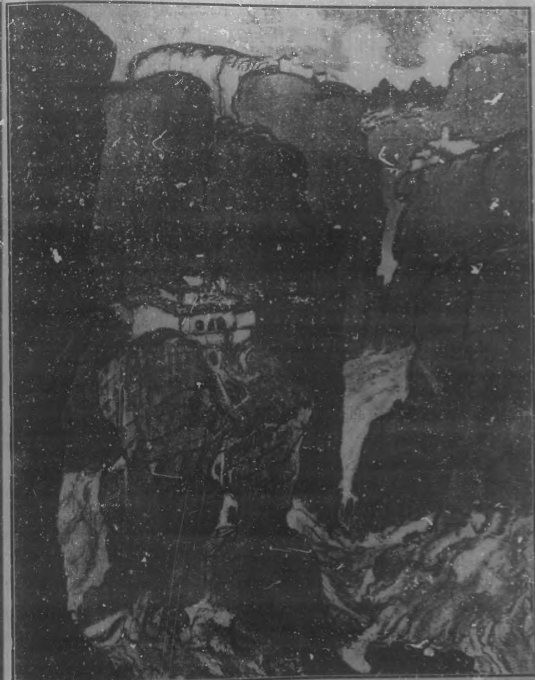
EL METEORON.—Antiguo monasterio inglés que está situado en la cima de la roca Firmacio, a cinco pies de altura.

Se publican todos los domingos, con excepción de los días de fiestas locales, nacionales y religiosas. Cable: "BOHEMIA" Telegrama: "BOHEMIA" Apertura: 8:30 a.m. Redacción, Administración y Oficinas: Edificio de "BOHEMIA", Trujillo, número 40, entre 2 y 3. — Teléfono: Dirección: 4-1940, Administración: 4-1941, Redacción: 4-1942.